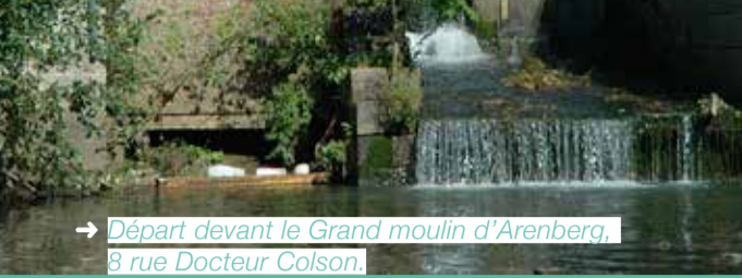
→ Départ devant le Grand moulin d'Arenberg, 8 rue Docteur Colson.

Les premières traces écrites de l'existence de ce moulin remontent au XV e s. C'est un modeste bâtiment d'un seul étage qui dépend des Seigneurs de Rebecq. A partir de 1606, il devient la propriété des Ducs d'Arenberg. En 1756, on édifie un second moulin sur l'autre rive de la Senne. Au milieu du 19 e s, avec l'ère industrielle, les moulins connaissent de profondes transformations : on parle dès lors de Grand et de Petit moulin. En 1864, les deux bâtiments sont mis en vente et sortent définitivement du patrimoine des Arenberg. Peu avant 1900, le Grand moulin est transformé en fabrique de soie artificielle et on y ajoute une machine à vapeur dont la grande cheminée est toujours visible. Cette activité cessa vers 1910 et laisse place à la fabrication d'aliments pour le bétail. Après 1960, le moulin n'est plus utilisé que comme entrepôt à grain et est racheté par la Commune de Rebecq en 1973 pour en faire un lieu de culture et de tourisme.