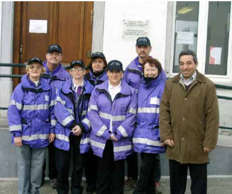
L'équipe des Gardiens de la Paix (ex « APS » assistants de prévention et de sécurité) de Rebecq .

Depuis janvier 2008, l'ancienne dénomination APS pour nos agents de prévention et de sécurité est remplacée par Gardien de la Paix selon la loi du 15 mai 2007 relative aux Gardiens de la Paix, cette loi visant à créer un service de Gardien de la Paix et donner un cadre légal pour l'ensemble des travailleurs de prévention et de sécurité publique non policier.