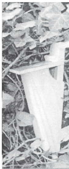
Nichoir à grimpereau

Comme chaque année, le PCDN va vous permettre d'acquérir ces gîtes à moindre coût puisque la commune intervient dans leur prix d'acquisition.