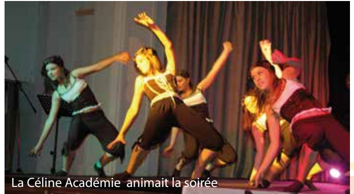
La Céline Académie animait la soirée