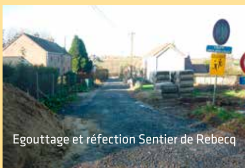
Egouttage et réfection Sentier de Rebecq