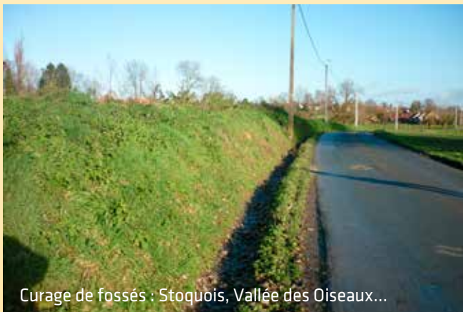
Curage de fossés : Stoquois, Vallée des Oiseaux...