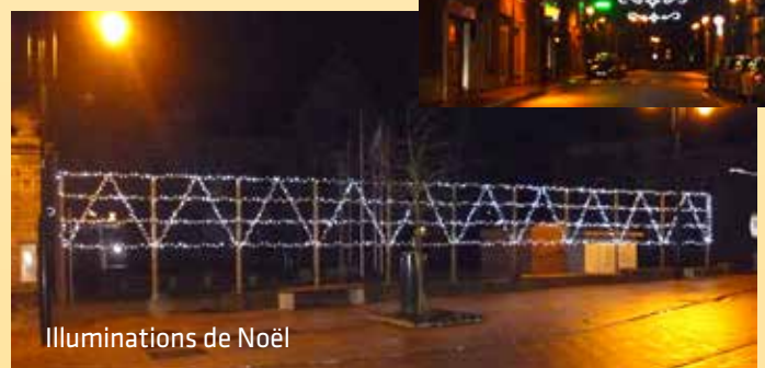
Illuminations de Noël