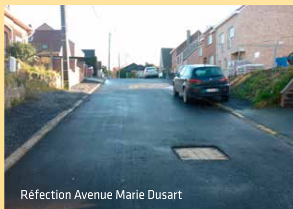
Réfection Avenue Marie Dusart