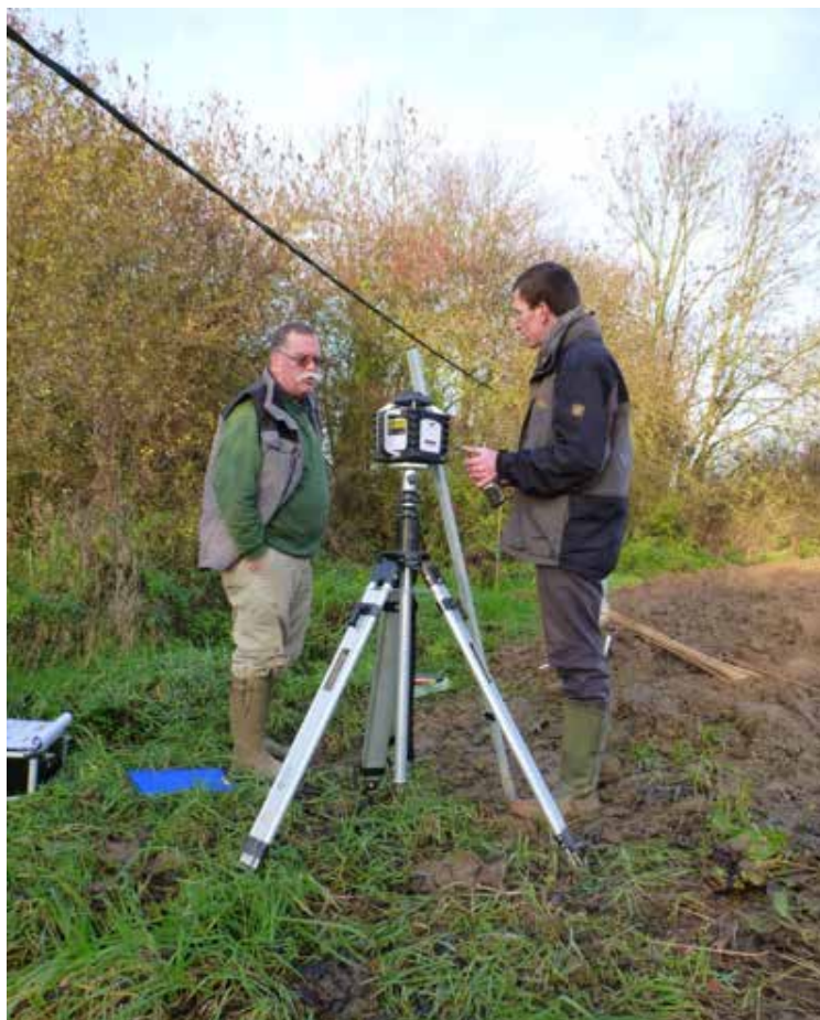
Placement des repères sur le terrain pour l'implantation des fascines en présence d'un expert de la cellule GISER et des exploitants agricoles.

Suivez l'évolution du niveau de la Senne en un clic Sur http://voies-hydrauliques.wallonie.be/opencms/opencms/fr/hydro/Actuelle/crue/cruetableau.do?id=5