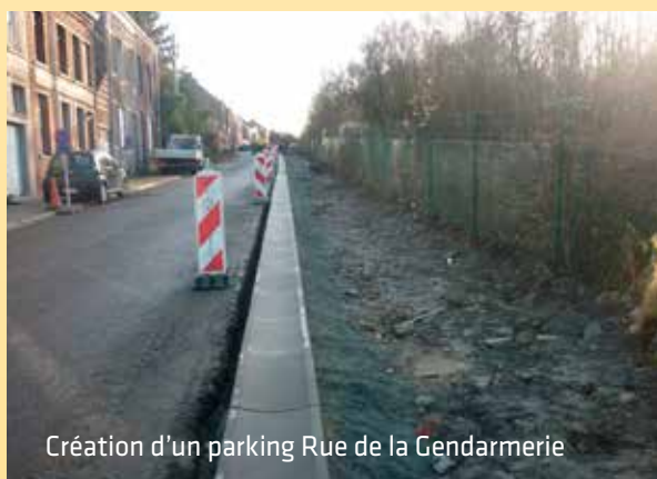
Création d'un parking Rue de la Gendarmerie