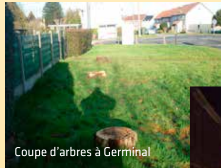
Coupe d'arbres à Germinal