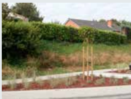
Plantations à la Gare de Rebecq