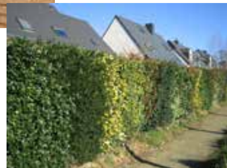
Haie plantée d'essences variées et régionales d'une hauteur de 1m60 à 2 m selon des prescriptions urbanistiques.

Les voleurs apprécient cette manière de pouvoir se cacher !