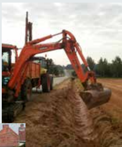
Profilage de fossés