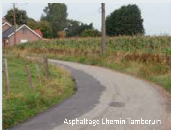
Asphaltage Chemin Tamboruin