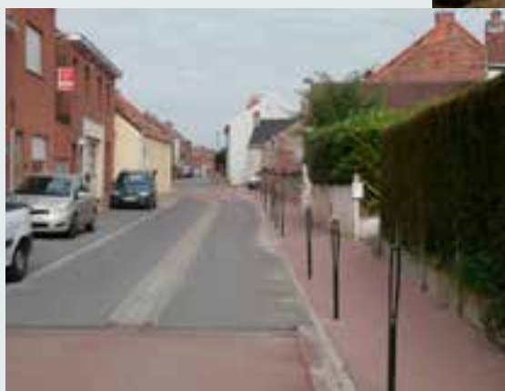
Travaux Chaussée de la Genette