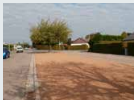
Réfection de l'espace central aux Rokètes