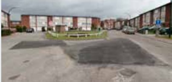
Asphaltage de rues dégradées (ex: avenue des Croix de Feu)