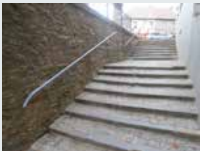
Rénovation de l'escalier Grand Place de Rebecq