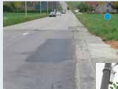
Réparation de l'effondrement de voirie Route de Quenast