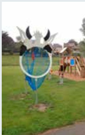
Placement de nasses à canettes dans les plaines de jeux et parkings