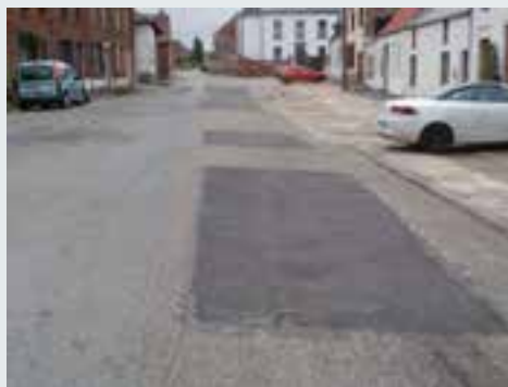
Asphaltage de portions dégradées Place de Wisbecq