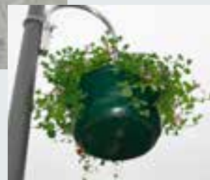
Placement de paniers fleuris