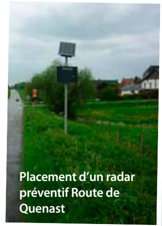
Placement d'un radar préventif Route de Quenast