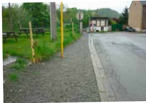
Création d'un trottoir Rue de la Station aux abords de la friterie