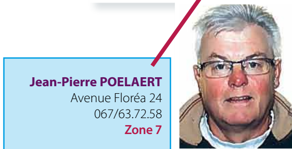
Jean-Pierre POELAERT Avenue Floréa 24 067/63.72.58 Zone 7