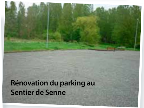
Rénovation du parking au Sentier de Senne