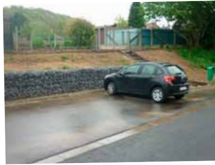
Assainissement et création de stationnements Cité des Carrières