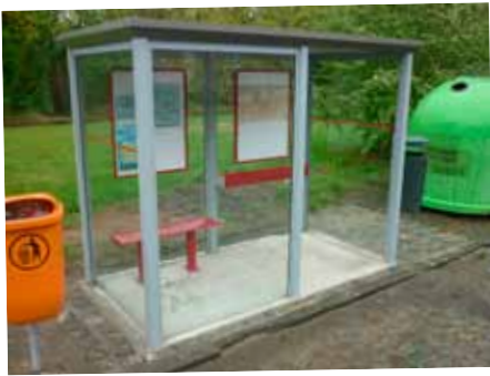
Remplacement de l'abribus vétuste Rue Haute Franchise