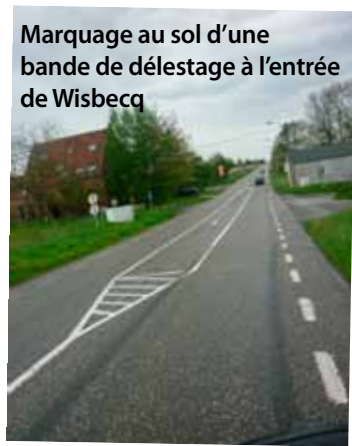
Marquage au sol d'une bande de délestage à l'entrée de Wisbecq