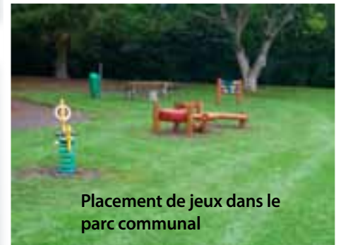
Placement de jeux dans le parc communal