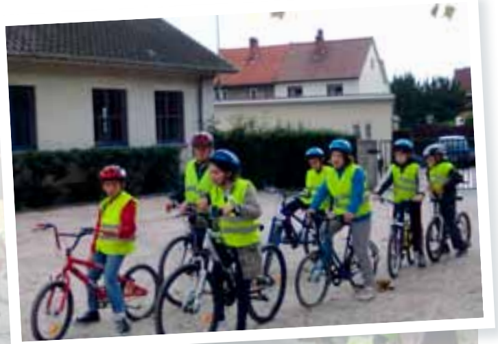
Ecole Communale de Germinal

On a constaté que nous n'étions pas prêts pour le tour de France.