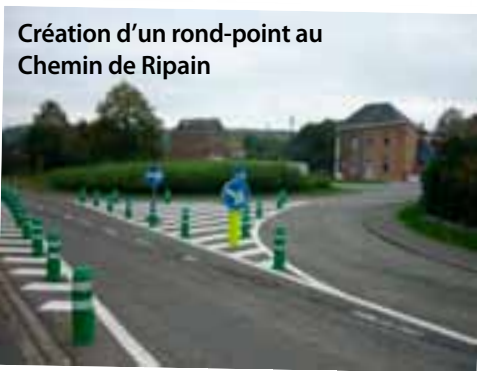
Création d'un rond-point au Chemin de Ripain