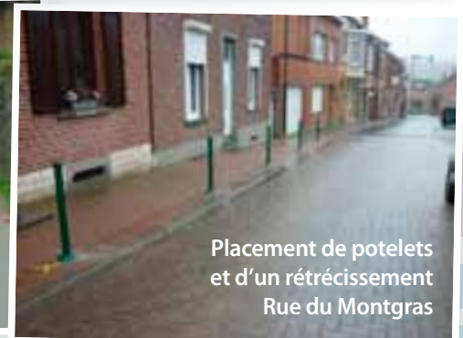
Placement de potelets et d'un rétrécissement Rue du Montgras