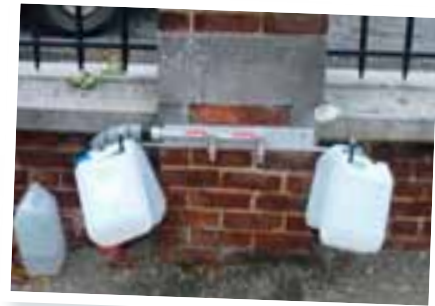
Placement de l'eau courante dans le cimetière de Bierghes