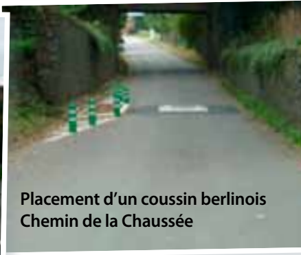
Placement d'un coussin berlinois Chemin de la Chaussée