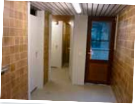
Renouvellement des carrelages et des menuiseries dans la zone sanitaire de l'Ecole Communale Ruelle Al Tache