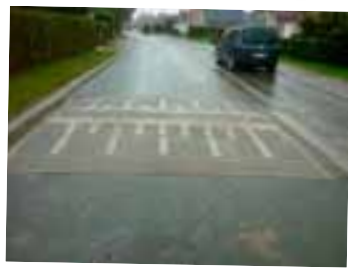
Réfection des casse-vitesses Rue Duc d'Arenberg