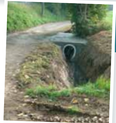
Mise sous tuyau du fossé au Rieu Diesbecq