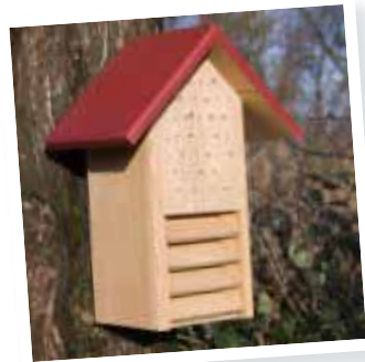
Armoire à abeilles et coccinelles

Les stocks seront limités sauf commande de votre part auprès de Damien HUBAUT au 0475/78.38.25 avant le 1er décembre 2011. Pour les demandes sur place, à défaut de commande, les articles seront disponibles dans la limite des stocks.