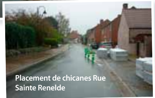
Placement de chicanes Rue Sainte Renelde