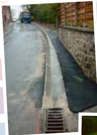
Création d'un filet d'eau Sentier Froidmont