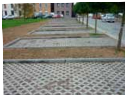
Création de zones de stationnement devant l'école de Bierghes