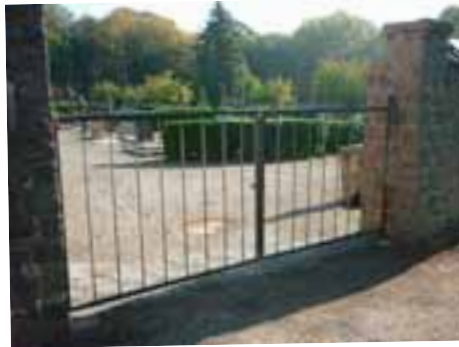
Travaux dans les cimetières