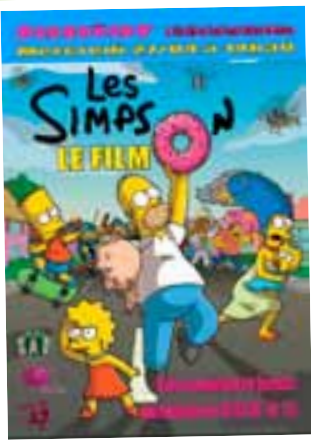
Simpsons, le Film Mercredi 27 avril à 14h30