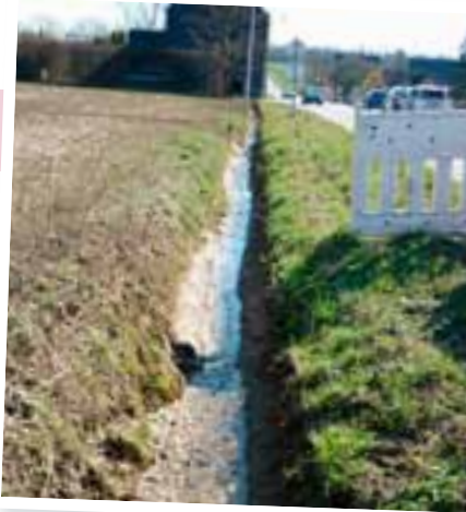
Curage de fossés