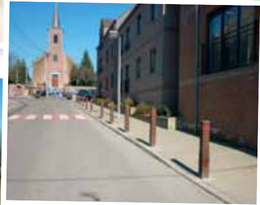
Placement de potelets au Chemin du Croly