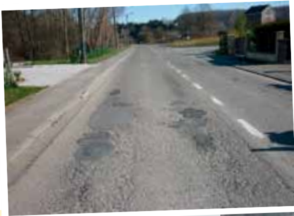
Asphaltage Chemin de Ripain