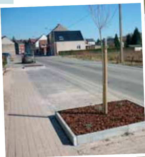
Fleurissement des parterres à Quenast