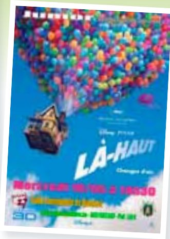
Là-haut Mercredi 18 mai à 14h30