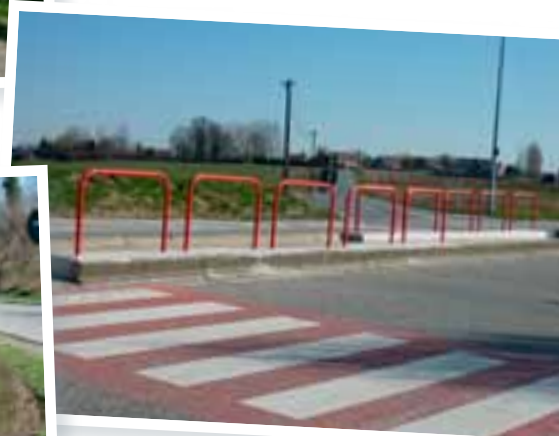
Sécurisation de la traversée piétonne Route Industrielle