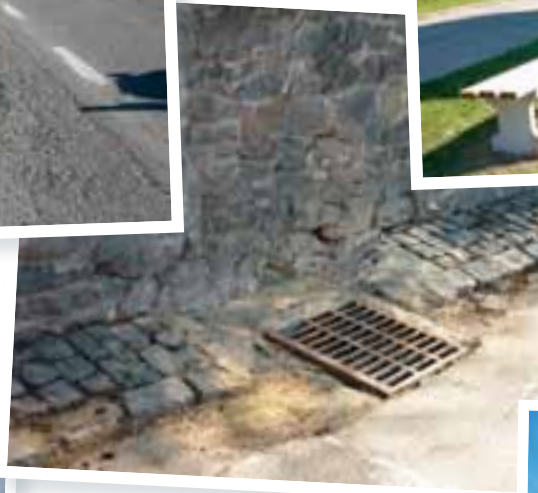
Nouvel avaloir Rue de Saintes