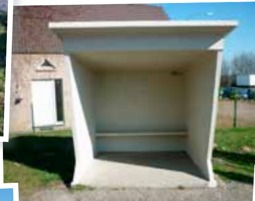
Mise en peinture de la cabine de bus Chemin de la Chaussée