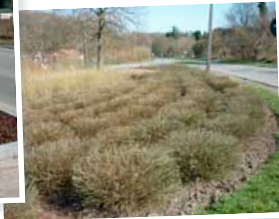
Taille des plantations