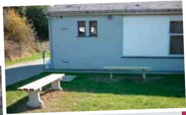
Placement de bancs à la Maison de Jeunes