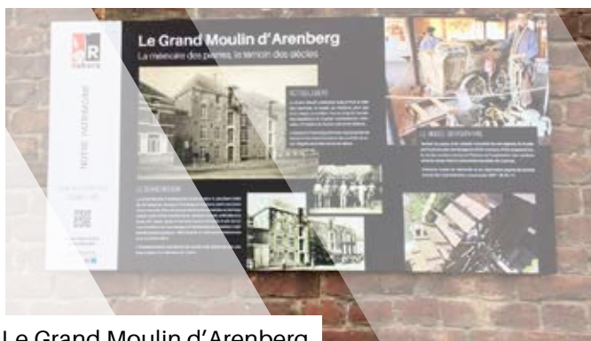
Le Grand Moulin d'Arenberg