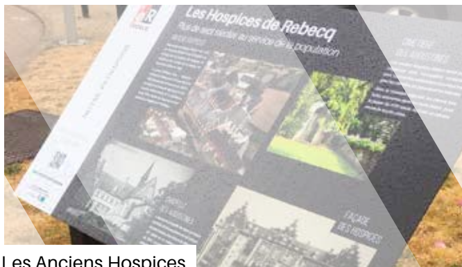
Les Anciens Hospices