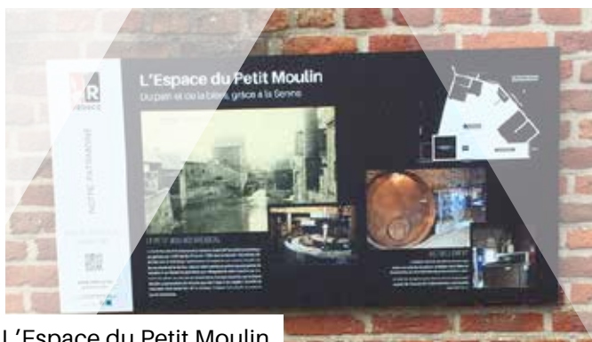
L'Espace du Petit Moulin