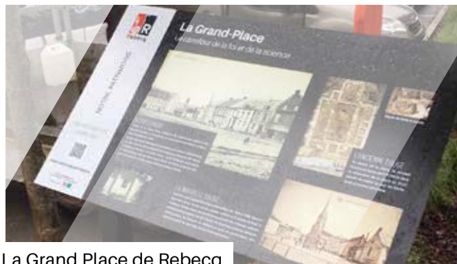
La Grand Place de Rebecq