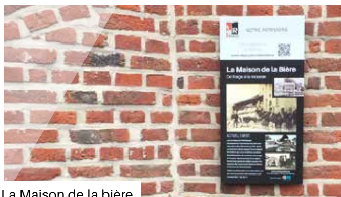
La Maison de la bière