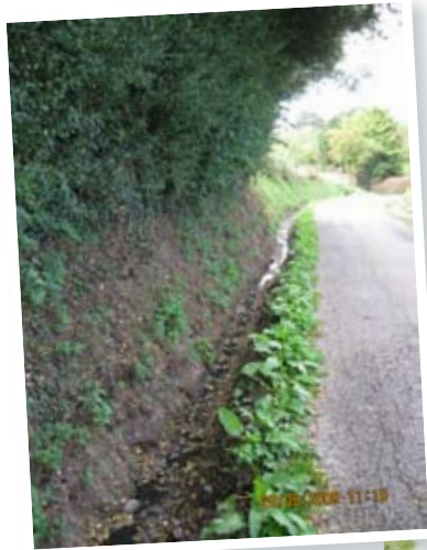
Réfection de la Rue du Sartiau et de la Rue Crollies

Réfection du plateau Sainte-Renelde, comme promis, dès la fin des travaux du centre